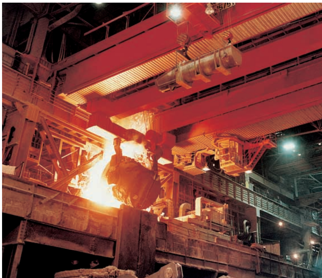
Загрузочный кран, Разливка из дуговой печи

Кабели другого сечения, а также многожильные кабели предоставляются по заявке. Для составления заявки используйте, пожалуйста, наш формуляр Запрос нестандартных кабелей.